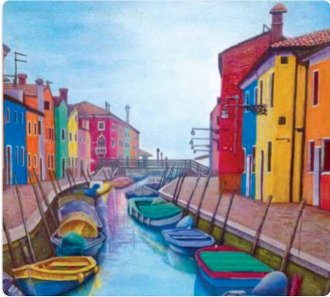
Natalya Badalova. Bild aus der Kunstausstellung "Zwischen Natur und Architektur", die ab 23. Oktober in Beratungszentrum arbewe (Pfründnerstr. 24, 90478 Nürnberg) läuft.